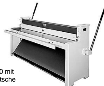
HS 2000 mit Blechrutsche