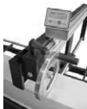
Manueller Tiefenanschlag von vorne verstellbar mit Digitalanzeige