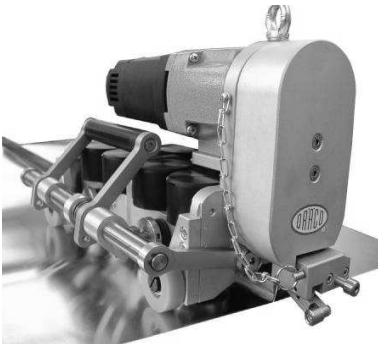
K9-1 mit Duo-Funktionsschalter